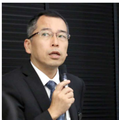
小暮教授(代表)による概要説明