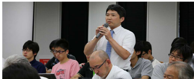
3名の先生方の口頭発表では活発な討議が行われました。