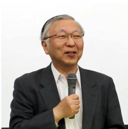
乾学長による開会の辞